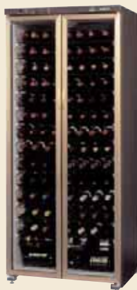
ST-401G II (B) ※オープン価格

フレンチドア(観音開き)にすることで、扉開閉のためのスペース確保が十分でなくても、ワインの出し入れがスムーズ。そのうえ、セラーとしての格調を高めています。