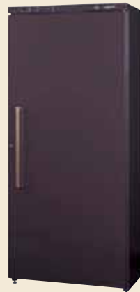
ST-401 (B) ※オープン価格