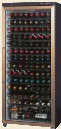
ST-401G (B) ※オープン価格