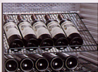
シャンブレア 傾斜ラック

「通常ラック」の他、店内ディスプレイ用として「傾斜ラック」「シガー用ラック」等を取り揃えました。