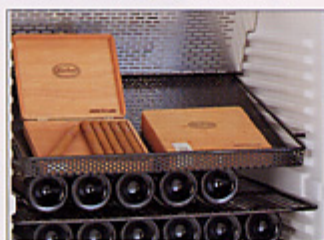
シャンブレア シガーラック