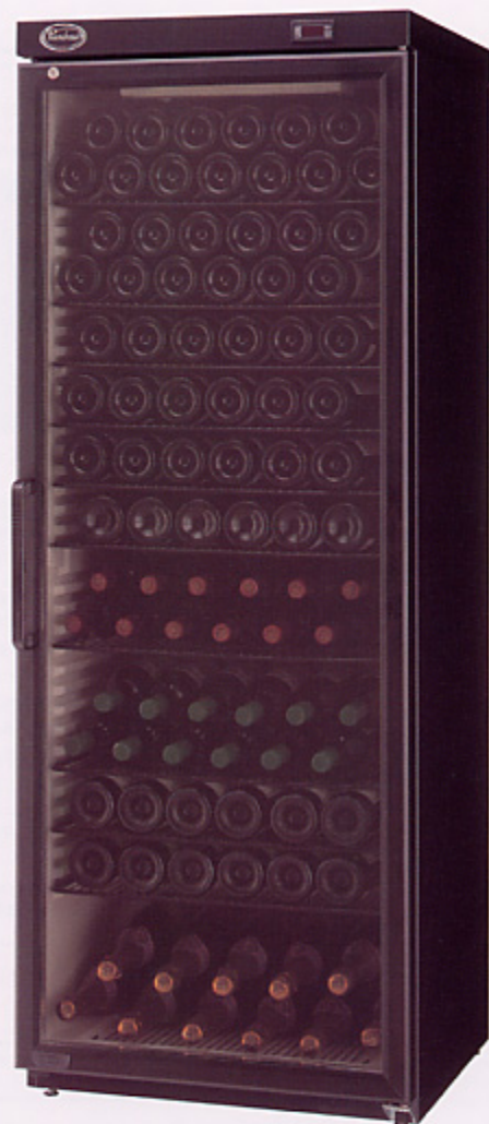
シャンブレアワインキャビネット